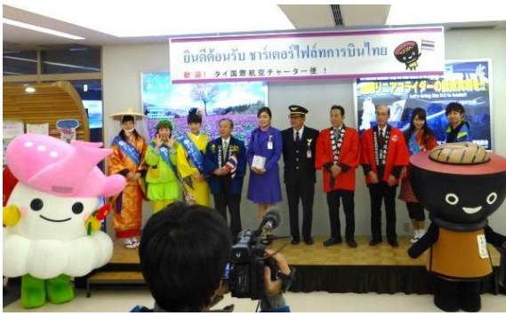
タイのチャーター便歓迎セレモニーの様子

タイからの一行は4泊5日の日程で北上展勝地ほか東北の桜や温泉などを楽しまれました。