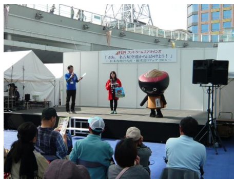
岩手県観光PRクイズ大会の様子

4月16日(土)〜17日(日)の二日間、FDA就航地等の観光・物産を紹介するイベントが名古屋市で開催され、岩手県、岩手県産物及び当協会職員が参加しました。岩手県ブースでの物販・観光PRのほか、「そばっち」が登場し、岩手県観光PRクイズ大会を行い、二つの世界遺産、浄土ヶ浜など岩手の魅力を紹介しました。