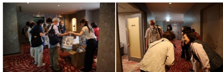
「よくおでったなは！」