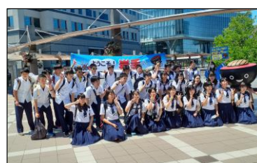
浦河第一中学校(北海道)