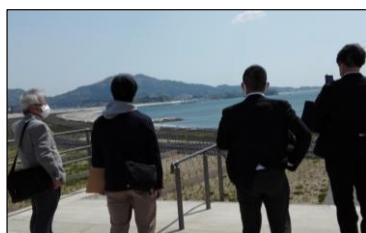
ア 浦賀中学校(3学年担当)事前視察