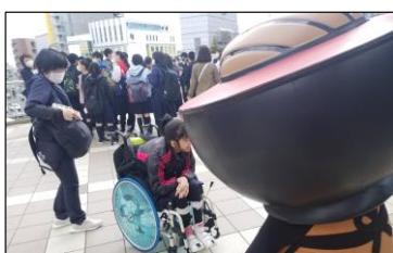
恵み野中学校(北海道)