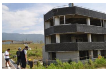
イ 白石中学校事前視察