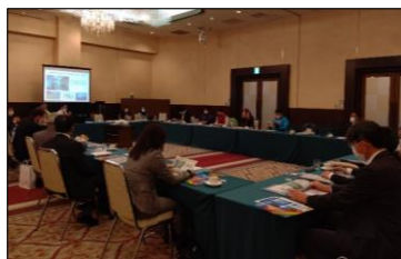
ウ 関東修学旅行委員会 岩手県セミナー