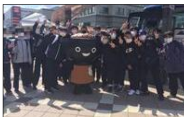
富丘中学校(北海道)