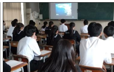
オ 加茂高校 事前学習