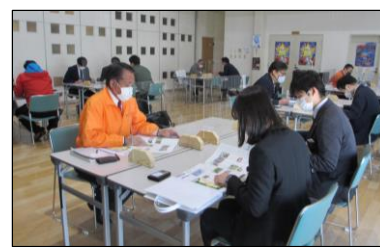
旅行会社担当者招請 商談会