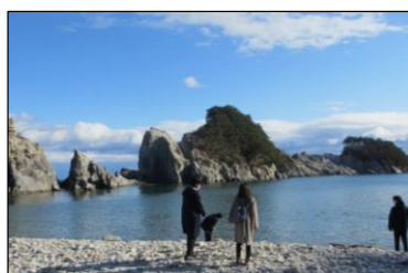
旅行会社担当者招請 2日目