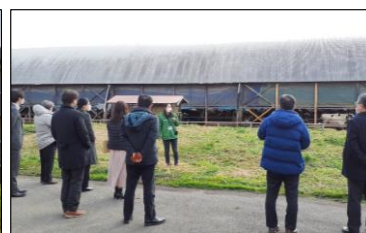
ウ 関東修学旅行委員会 視察