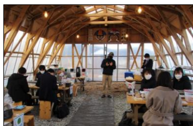
旅行会社担当者招請 1日目