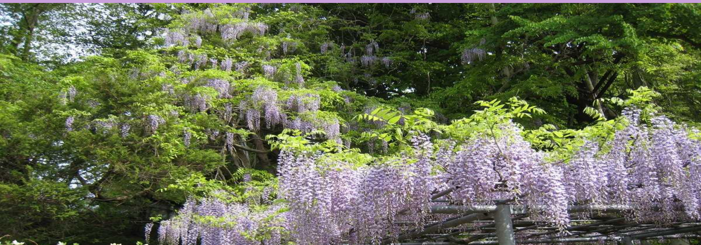
▲ 藤島のフジ（例年の様子）